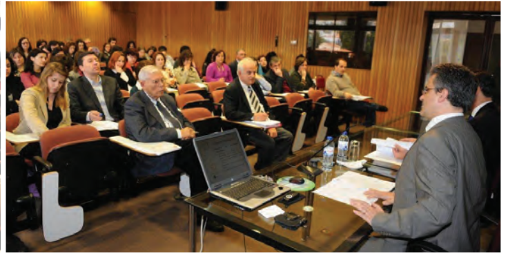
Exemplos de acções de Formação em que participaram colaboradores da ECAM